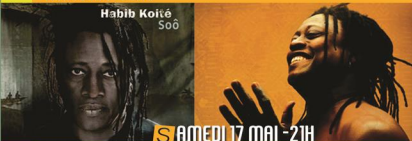
Habib Koité Soô

Entrée sur place : 15 € Tarif réduit* : 10 €