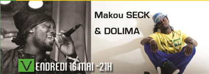
Makou SECK & DOLIMA

Entrée sur place : 15 € Tarif réduit* : 10 €